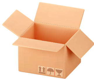
Empaque terciario (Envase)