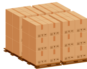
Unidad de carga

En el contexto logístico, cabe destacar el papel de la unidad de carga. Se trata de la unidad básica que utiliza la empresa en el transporte y almacenaje de sus productos. Pueden ser estibas, cajas, contenedores, bidones, bobinas, grandes recipientes para productos a granel (GRG, IBC), sacos o big-bags.