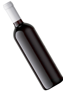
Empaque primario (Envase)