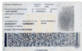
Tarjeta de propiedad