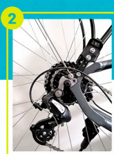
Tensor de cadena