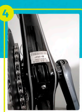
Número de marco o cuadro