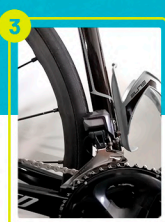
Descarrilador de cadena